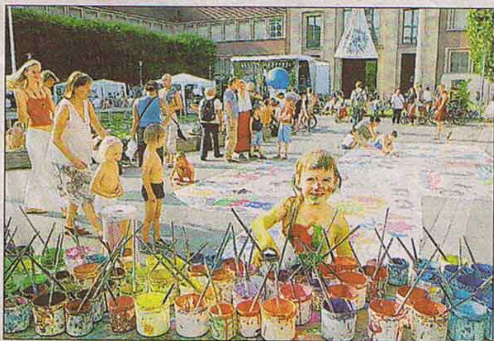
Buntes Treiben am Ehrenhof: Zum zehnten Mal fand das Eine-Welt-Fest unter anderem mit großer Malaktion statt.